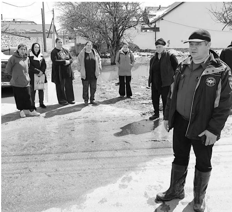
ДР-лул МЧС-рал министрнал хъиривчу Илдар Атаев зарал бивминначIа

Хукму бунни щин цайнура цурда духлаганнин бацIан, ми цуксса яларай дагъайрив ххал даншивул. НигъачIаву дусса къатрал заллухъруннан бунни мюхчаншиву дуруччинсса маслихIатру. Бувсунни бивсса заралданунсса кумаг властирдал чулуха ккаккан бувну бушиву.