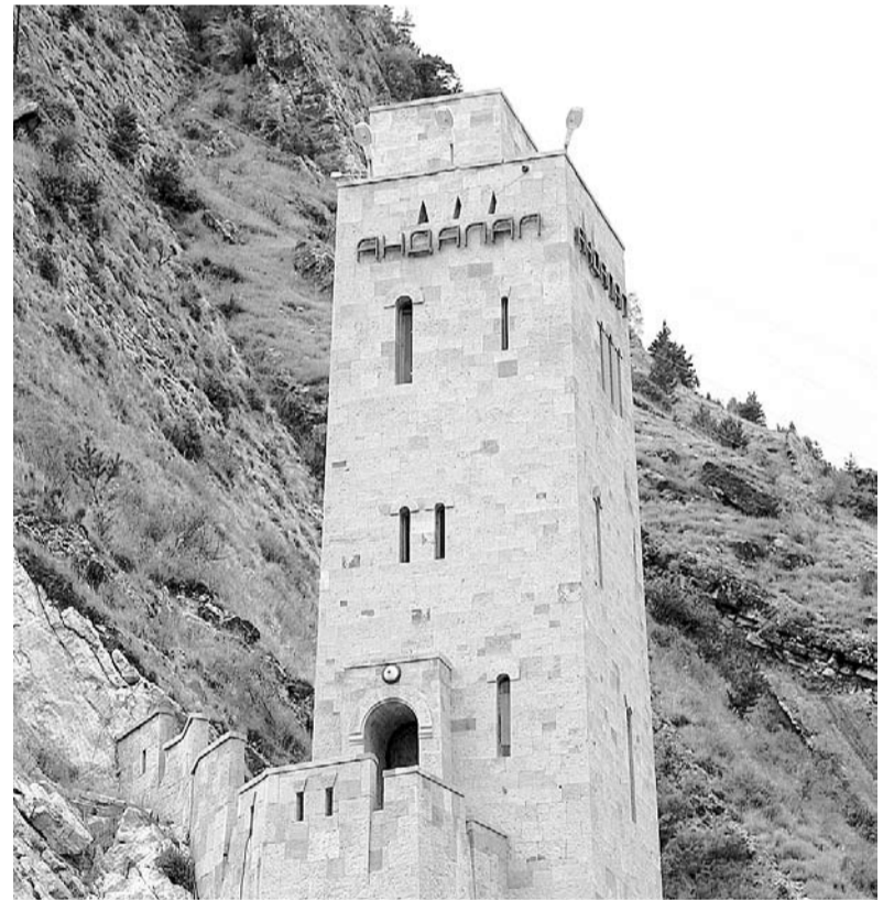
ЧIюйрдал комплекс «Андаал»