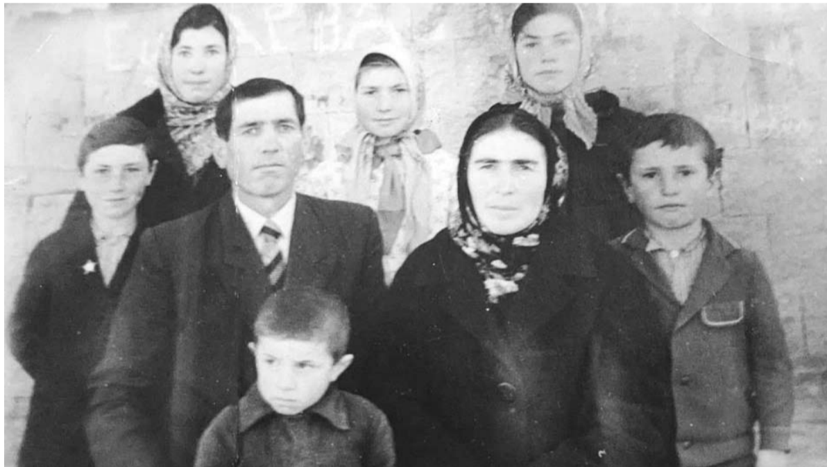
Мисиду ниттил махъ

Ккулув зий хъунма хӀал къабарчагу, кӀулшивуртту дусса, дарс ххуйну дишайсса, оьрчӀагу ччаву дусса учительница ччяни ххира хъуну бур ва хӀакъинусса кӀинику дакӀний бур Ккулалл жяматран. Цанасса чӀумалгу ванил дарс дирхъусса оьрчӀру, миннал нину-ппу, оьвтӀий, цӀухху-ккакку буллан бикӀай.