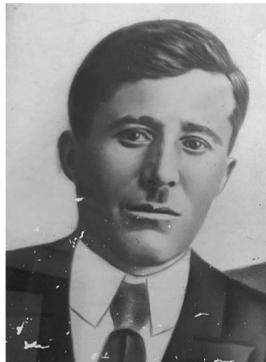
Омаров Абдулманап, цалчин Ттуплисулал университет къртал бувсса