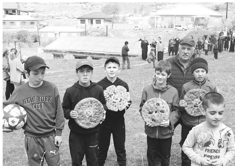
ХъьичӀун ливчуминнан бартри

даву хъуна лавайсса даражалий, цимирагу шинай шаллу дуллай, цӀакъ хъусса аьдатирттайну, сценарийлийну. Шадлугъ-