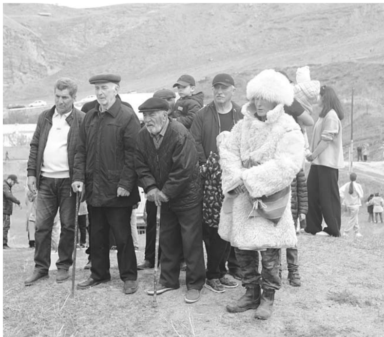
Хъун хъузала Гарайхан ва шярваллил хъунисри

Цивпагу, оьрчӀругу, гъанмаччами, дултал ва шаллагу шярваллил жяматту, хъамалгу лагма лавгун дуллалисса ва