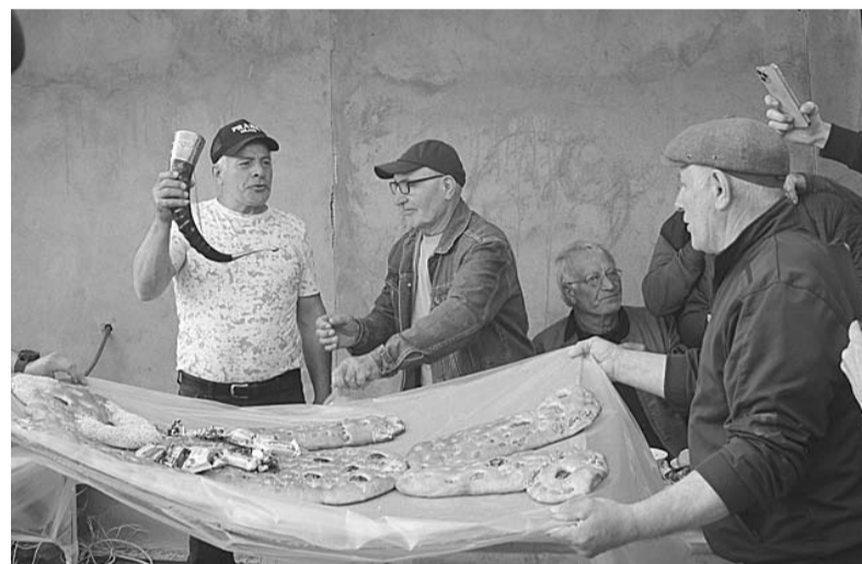
ЯлунчӀин хъарас шунсса Къуру лавсисса аьдат шаллу дуллай