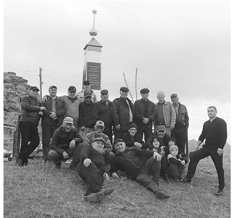
Новостройрайсса шушими ва вайннал кьини хьун дуван бувксса кундими Шушияв

Ва кьини махъатунин чюхлай бия шярвух дьявилул шиннардий ва махъ чивчусса, цавугу ххисшала бакъа бюхханну дьявилья бусласисса, дьявилул чумалгу аьралитурал дакру дуллай бивксса ца дурксса балайрду.