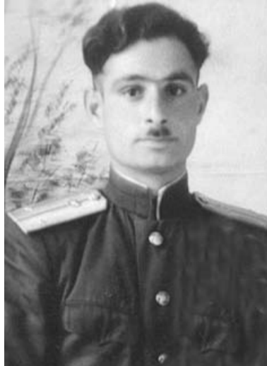
Минкаилов Исмяил Яттул майданни дучри ххяххан баврил бьаст-ччалливу ххув ххуссар. Сталиннул ссят бахшиш дурссар