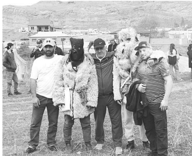
КӀундивсса Хъурдаккаврил байрандалул ца лишанну хъанакъисса «къяци-барцӀру»

Хъурдаккаврил байрандалийн архсса Архангельскалия бувкӀун бия ХӀусайннул – Гарайханнул арсенал дулталгу. Жучанма бувкӀсса оьрус миллатрал вакилтал хъинну рязину лавгунни, жулла тӀабиаьгърая, жулва багъу-бизулия, аьдатирттая, кувннал кувнналалсса арардая хӀайранну.