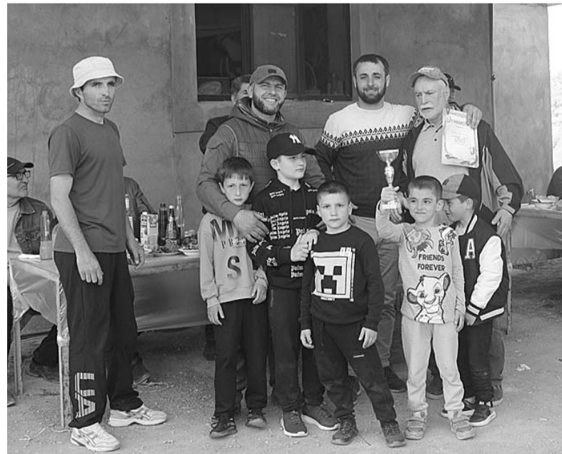
Спортрал бьаст-ччаллай хъьичӀун ливчуми