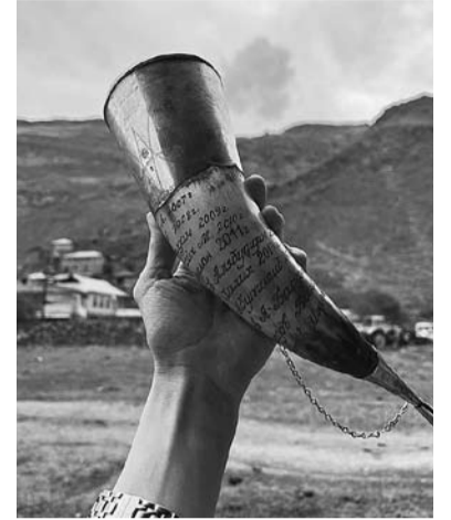
Гъарца шинал ва байран дурнал цIа чичайсса ва ялуннин байрандалул сакиншинна цайнна ларсманхъхъун булайсса Къуру