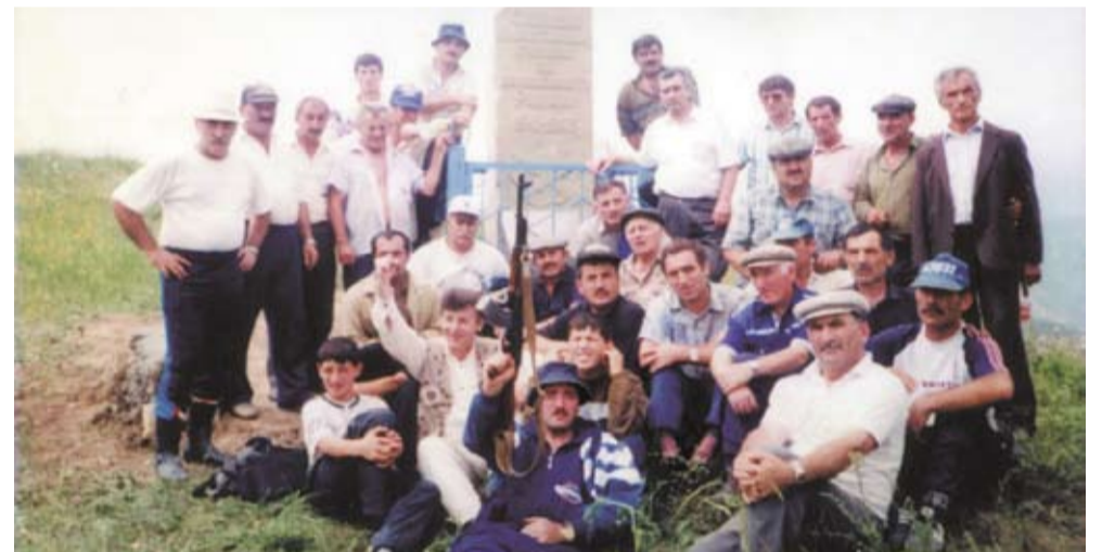
Дъявилул гурттучитуран дацан дурсса гъайкалданучла