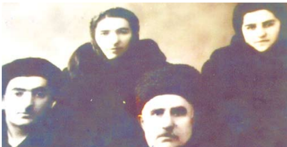
Пиризи ва ванал наслу