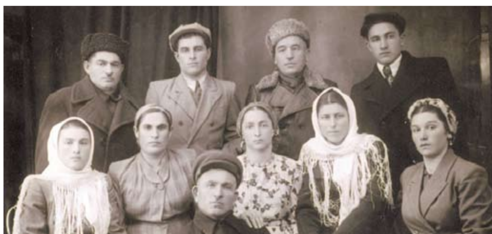
Ашттарханнай яхъанай бивклсса виратти