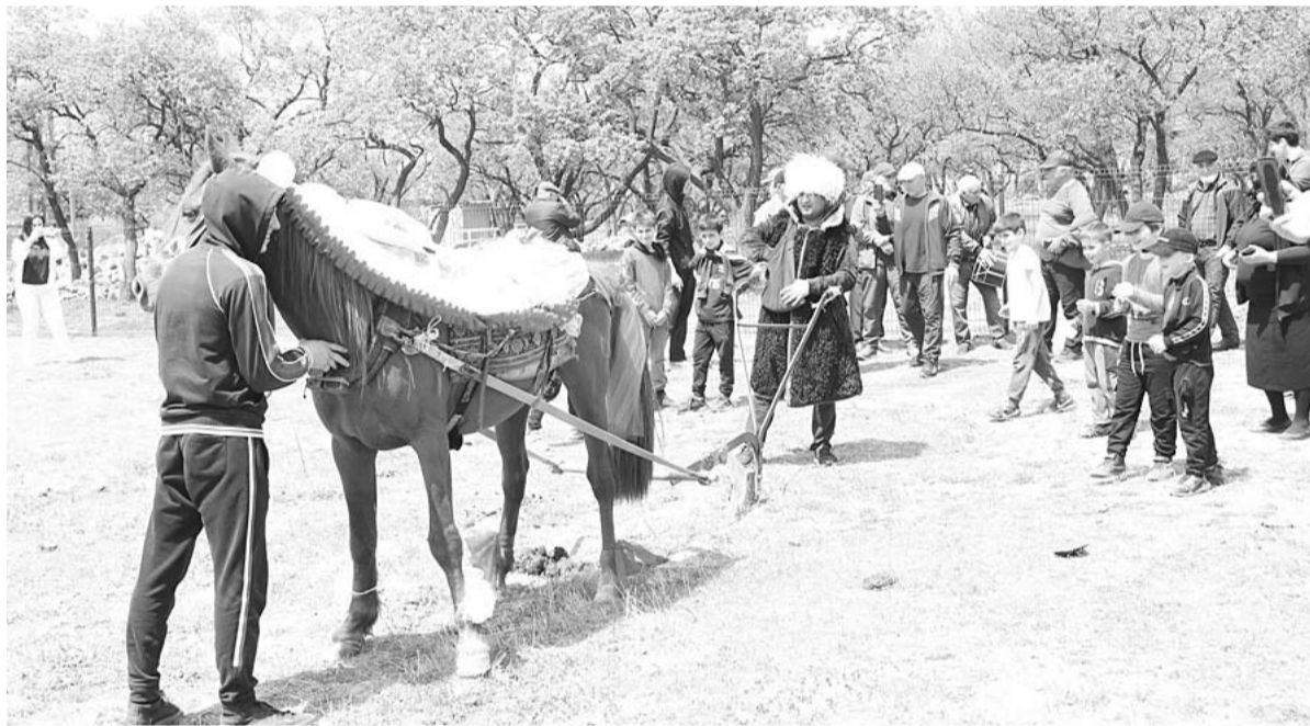
ттукъа ва тахIни-кIичIу, лавхъун бартбису.

Муслимлул ва Тамарал чIарав бацIан, зунтгал халкъуннал хъхичIарасса аьдатураи тамаша буван, лагмасса шархъая тIайла хъуну, Калининградраин биянинисса шагърурдай бувкIун бия чIявусса инсантал.