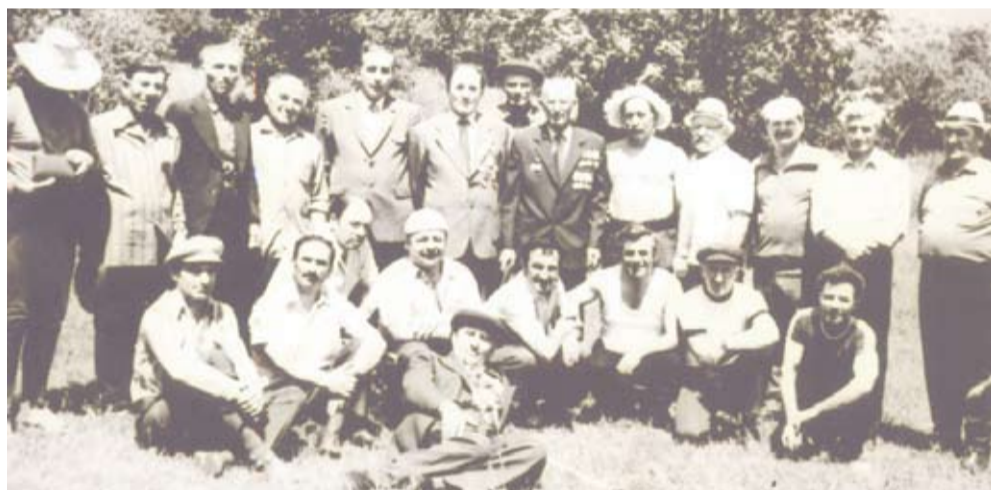
Хъун дъявилул гурттучитуралсса хъунабакъаву