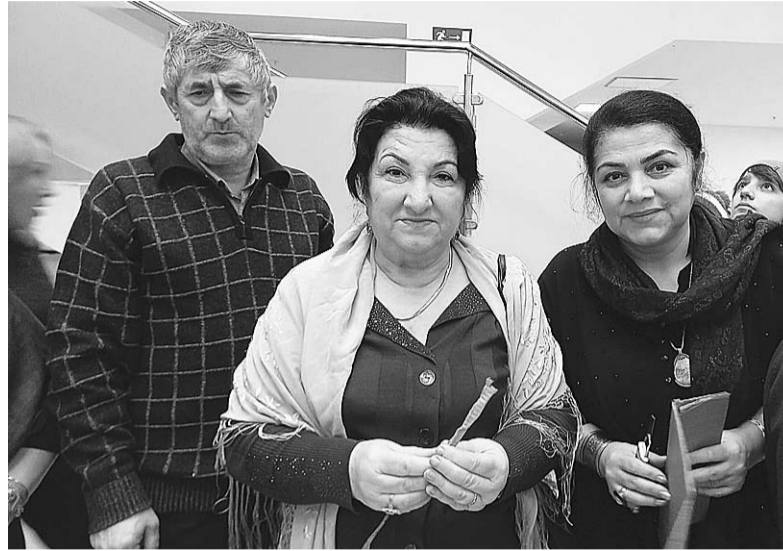
ХІажи ва Марзият Илиясовхьул Интизар Мамутаевацал