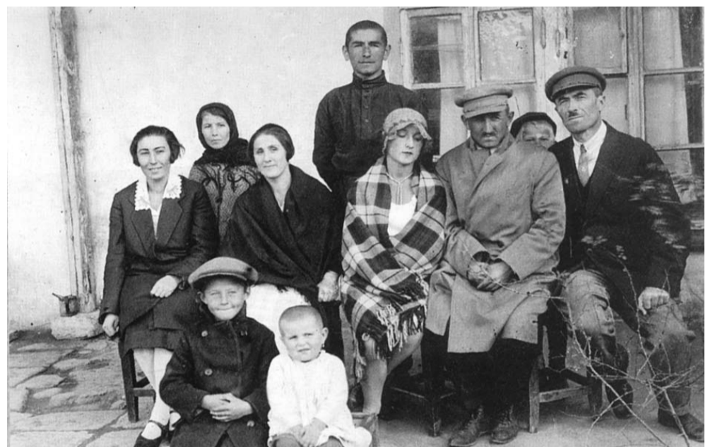
Гъан-маччаминнал дянив. 1930 ш.