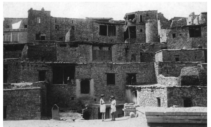
Хъьичлавасса Гъумучиял члалчин