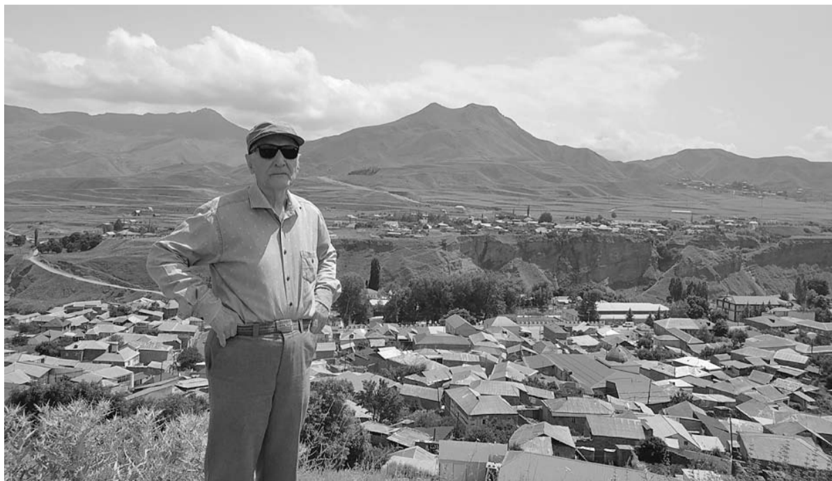
Буттал шярвалу чІалачІиний

1966-ку шинал аспирантура-гу къуртал бувну, лайкьну ду-рурччуну дур ванал медициналул элмурдал кандидатнал цІа. 1974-1989-ку шиннардий Хіажи зун ивкІун ур Дагъусттаннал