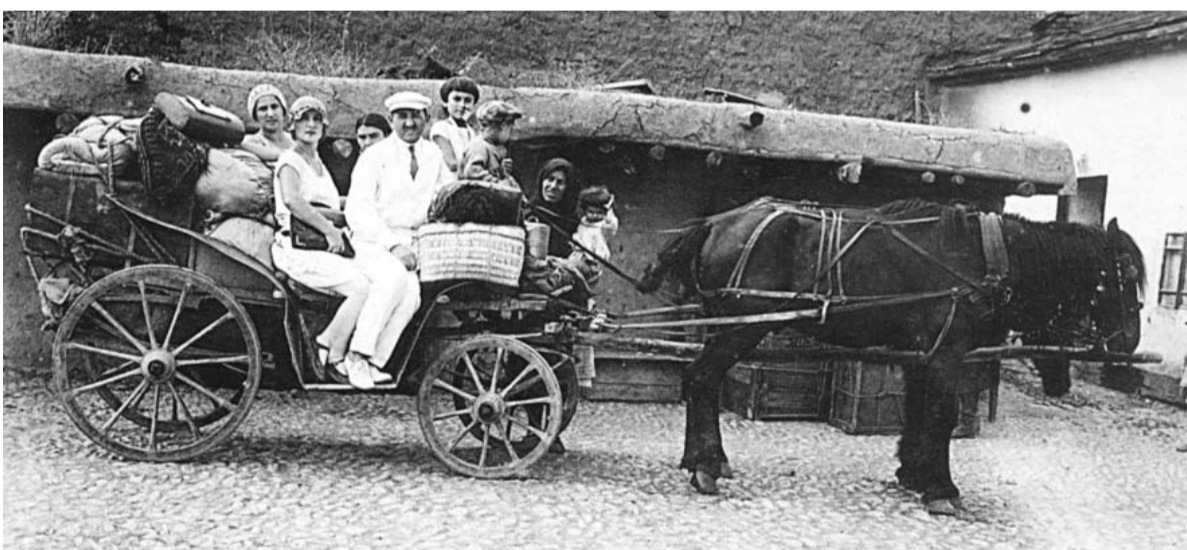
Махаммадгу, Еленагу Гъумукун нани ххуллий. 1930 ш.