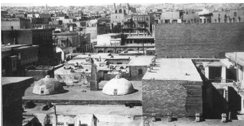
Бакуйсса Къажлаевхъал къатрал ларзулатусса члалчин. 1929 ш.