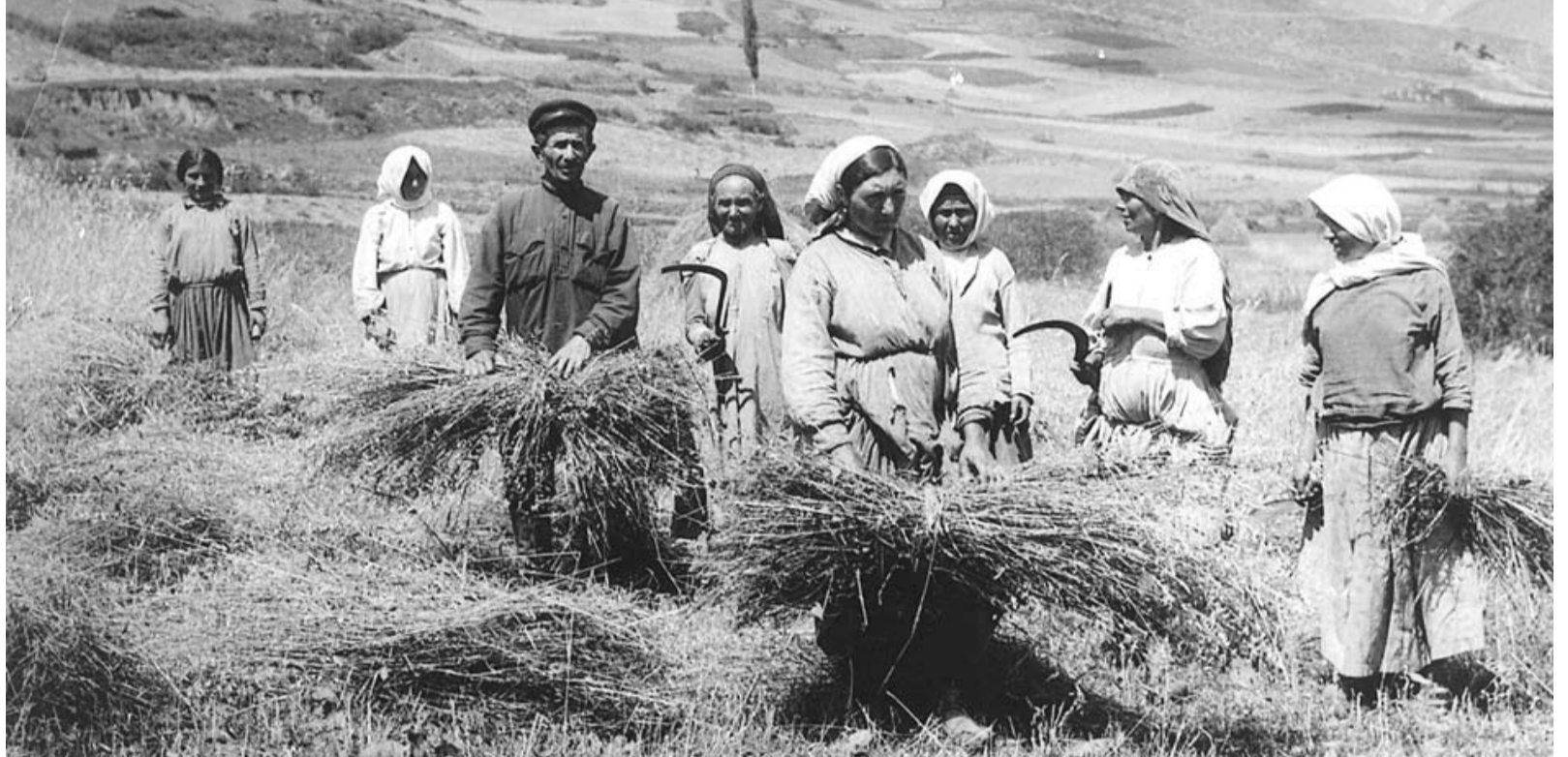
Гъумучиял цалчинсса колхозниктал. 1930 ш.