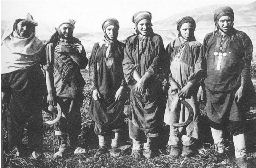
Вихьуллал хлүхлалт. 1932 ш.